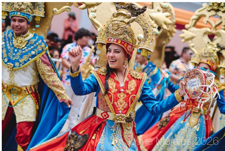
Integrante de la comparsa La Resistencia Carnavalera del barrio San Sebastián (2026)

Nota. La imagen muestra a una participante de la comparsa La Resistencia Carnavalera, perteneciente al barrio tradicional San Sebastián de la ciudad de Cajamarca. Su presencia representa la participación de sectores urbanos en la celebración del carnaval de 2026.